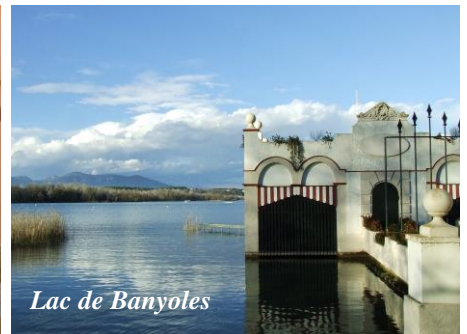
Lac de Banyoles