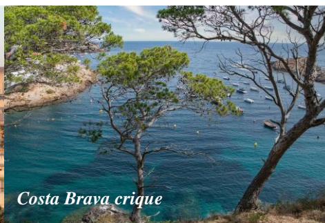
Costa Brava crique